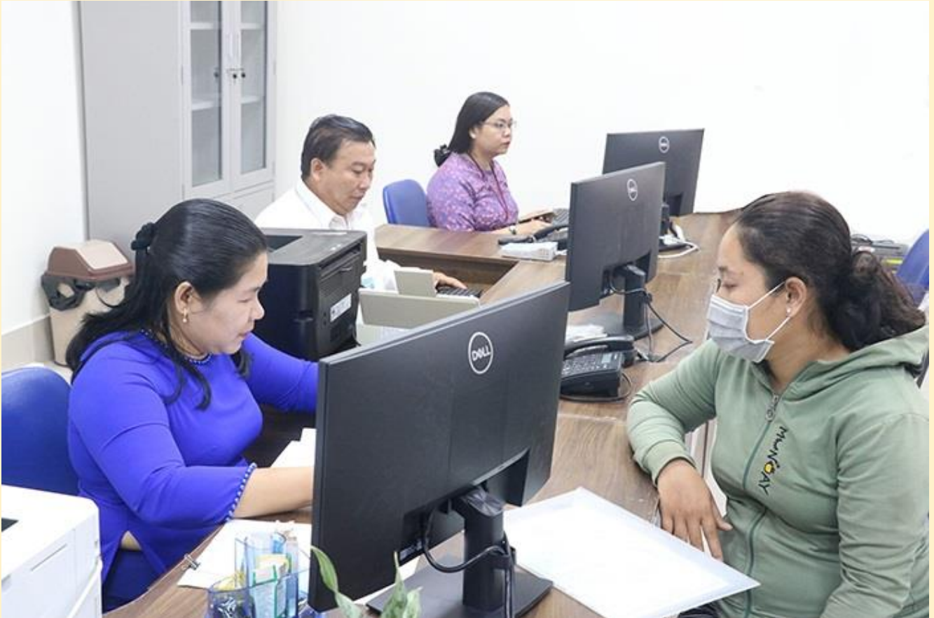
Người dân thực hiện TTHC tại Trung tâm Phục vụ hành chính công TP Cần Thơ.

ngiệp. Người dân được đón tiếp và hướng dẫn thực hiện TTHC chu đáo, lịch sự, tạo môi trường thân thiện, chuyên nghiệp. Từ ngày 26-2 đến ngày 7-3, Trung tâm đã tiếp nhận 7.642 hồ sơ, trong đó tỷ lệ hồ sơ trực tuyến đạt 61,5%; tỷ lệ số hóa thành phần hồ sơ đạt 39,9%; tỷ lệ số hóa kết quả giải quyết TTHC đạt 42,6%; tỷ lệ hồ sơ thanh toán trực tuyến đạt 19,2%.