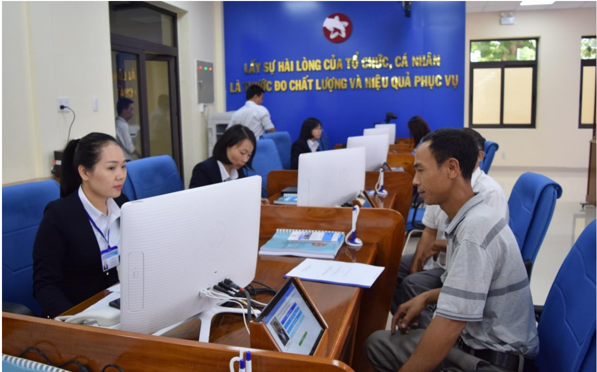
Trung tâm phục vụ hành chính công cấp tỉnh Kom Tum

(Chinhphu.vn) - Văn phòng Chính phủ đang dự thảo Quyết định của Thủ tướng Chính phủ về việc lựa chọn thủ tục hành chính của cơ quan được tổ chức theo hệ thống ngành dọc đặt tại địa phương được tiếp nhận tại Trung tâm phục vụ hành chính công cấp tỉnh, Bộ phận Tiếp nhận và Trả kết quả giải quyết thủ tục hành chính cấp huyện, cấp xã.