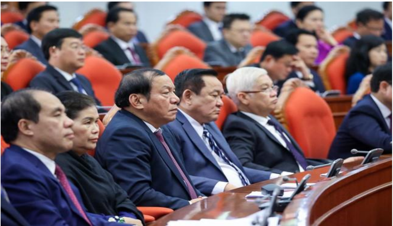
Hội nghị Ban Chấp hành Trung ương lần thứ sáu

Về cơ chế kiểm soát quyền lực nhà nước; đẩy mạnh phòng, chống tham nhũng, tiêu cực, Trung ương yêu cầu hoàn thiện cơ chế thực thi quyền lực nhà nước, xác định rõ hơn vai trò, vị trí, chức năng, nhiệm vụ, quyền hạn cụ thể của mỗi cơ quan và mối quan hệ giữa các cơ quan nhà nước trong thực hiện các quyền lập pháp, hành pháp, tư pháp. Qua đó, bảo đảm quyền lực nhà nước là thống nhất, có sự phân công rành mạch, phối hợp chặt chẽ và tăng cường kiểm soát quyền lực bên trong mỗi cơ quan và giữa các cơ quan nhà nước, giữa Trung ương và địa phương, giữa các cấp chính quyền địa phương và giữa các cơ quan trong cùng một cấp chính quyền.