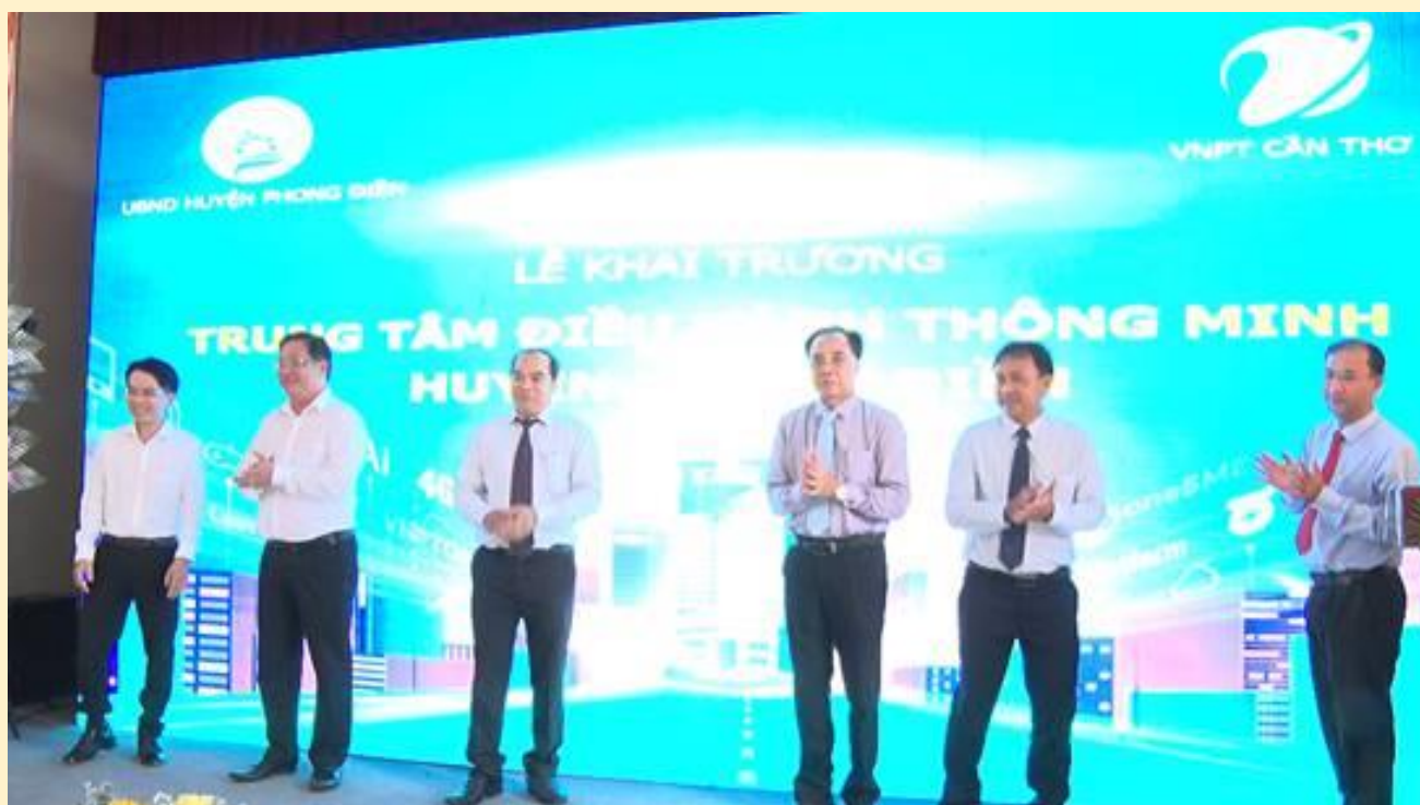
Lễ khai trương Trung tâm Điều hành thông minh huyện